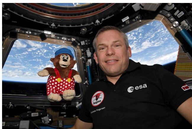
Figur 1. De to første danske astronauter, Andreas Mogensen og Rasmus Klump, nyder udsigten til Jorden.

Fra 26. august 2023 til den 12. marts 2024 har ESA's astronaut Andreas Mogensen opholdt sig ombord på Den Internationale Rumstation ISS, hvor han har været kommandør. Det har naturligt nok vakt en hel del opmærksomhed i Danmark, og forhåbentlig vil det smitte af på interessen blandt børn og unge for en karriere indenfor rumbranchen. Det har i hvert fald været formålet med at anvende omkring 17 millioner kroner til udstillinger, foredrag, undervisningsprojekter, konkurrencer og PR-arrangementer centreret omkring hjemmesideportalen Rumrejsen2023.dk. Desuden har dansk industri og danske forskere bidraget med 10 videnskabelige eksperimenter, som Mogensen har arbejdet med under Huginn-missionen, ind imellem alt