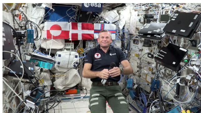
Figur 2. ESA-astronaut Andreas Mogensen i færd med et af mange "in-flight calls" til Danmark fra Columbus-modulet på ISS, og med Rigsfælleskabets flag i baggrunden.

hans andet arbejde ombord, og han har medbragt en snes danske "kulturgenstande" som rækker fra Niels Bohrs Nobelprisguldmedalje til en Rasmus Klump-bamse.