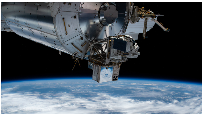
Figur 5. ASIM er den blå kasse, som her ses monteret på det europæiske Columbus-modul på Den Internationale Rumstation ISS.

Det til nu største danske rumprojekt er instrumentet ASIM, som siden 2018 har været installeret udvendigt på ISS. ASIM observerer udladninger i Jordens atmosfære, som udsendes fra skyerne og opad, og som er langt kraftigere end de lyn, vi normalt ser mellem skyerne og jordoverfladen. Denne mangfoldighed af fænomener med navne som røde feer (red sprites), elver og blå stråler (blue jets), er kortvarige udladninger af ukendt oprindelse, og som forekommer sammen med udbrud af gamma- og røntgenstråler, som ASIM også registrerer. De optræder i så stort antal, at de formentlig har indvirkning på atmosfæren og dermed på klimaet.