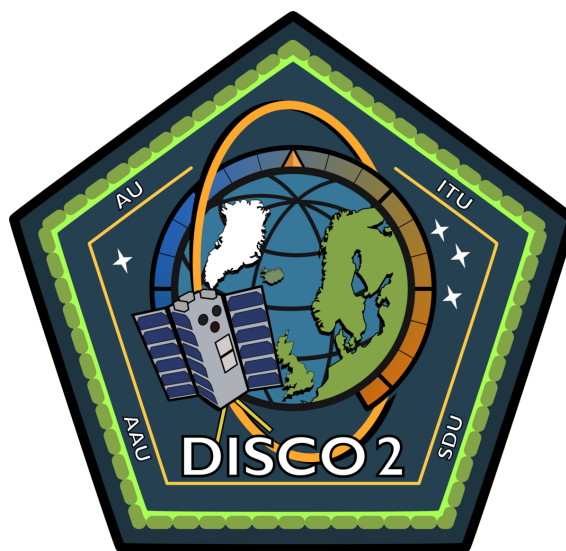
Figur 4. Bomærke for studentersatellitten DISCO-2. Illustration: DISCO-2/AU.

Blandt rækken af danske satellitter skiller især Ørsted sig ud. Den er med fuld ret blevet kaldt "Den lille seje satellit" (i en bogtitel). Med en vægt på omkring 60 kg og en største udstrækning på 72 cm – som et rullekabinet med skrivebordsskuffer, kom den med som passager ved en amerikanske raketopsendelse den 23. februar 1999. I pressen var man mest interesseret i at berette, at det tog 10 udsatte forsøg, før opsendelsen endelig blev til noget, men Ørsted var nu ikke årsag til nogen af udsættelserne. Formålet med Ørsted var præcisionsmålinger af Jordens magnetfelt, og det klarede den lille satellit så fint, at de modeller for magnetfeltet, som blev beregnet fra Ørsteds data, i en årrække var international standard. Den formelle datamodtagelse blev afsluttet i maj 2015, fordi SWARM-satellitterne, som blev opsendt i november 2013 kunne tage over og levere endnu bedre data. Selvom Ørsted-satellittens levetid var planlagt til 14 måneder, fungerer den forunderligt nok stadigvæk her i 2024, hvor den har fejret sit 25-årsjubileum .