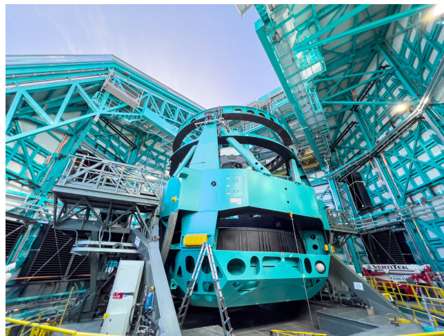
Figur 2. Den massive støttestruktur til teleskopet med den åbne observatoriumskuppel.

Figur 2 viser monteringen af det 8,4 m store Simonyi-teleskop. Teleskopet har et unikt tre-spejlsdesign, hvor det indfaldende lys opsamles af et 8,4 m primært spejl. Dette reflekterer lyset til et 3,4 m konvekst sekundært spejl og videre til et 5 m konkavt tertiært spejl, der dirigerer lyset ind i kameraet. Det mest unikke er, at primær- og tertiærspejlene er fremstillet af det samme monolitiske substrat ved hjælp af en helt ny borosilikat-teknologi udviklet af Richard F. Caris Mirror Laboratory ved University of Arizona i Tucson, USA. Teleskopets design resulterer i en åbning på 6,7 m og et bredt synsfelt på himlen på 9,6 kvadratgrader. Dette er cirka 40 gange Månens overflade.