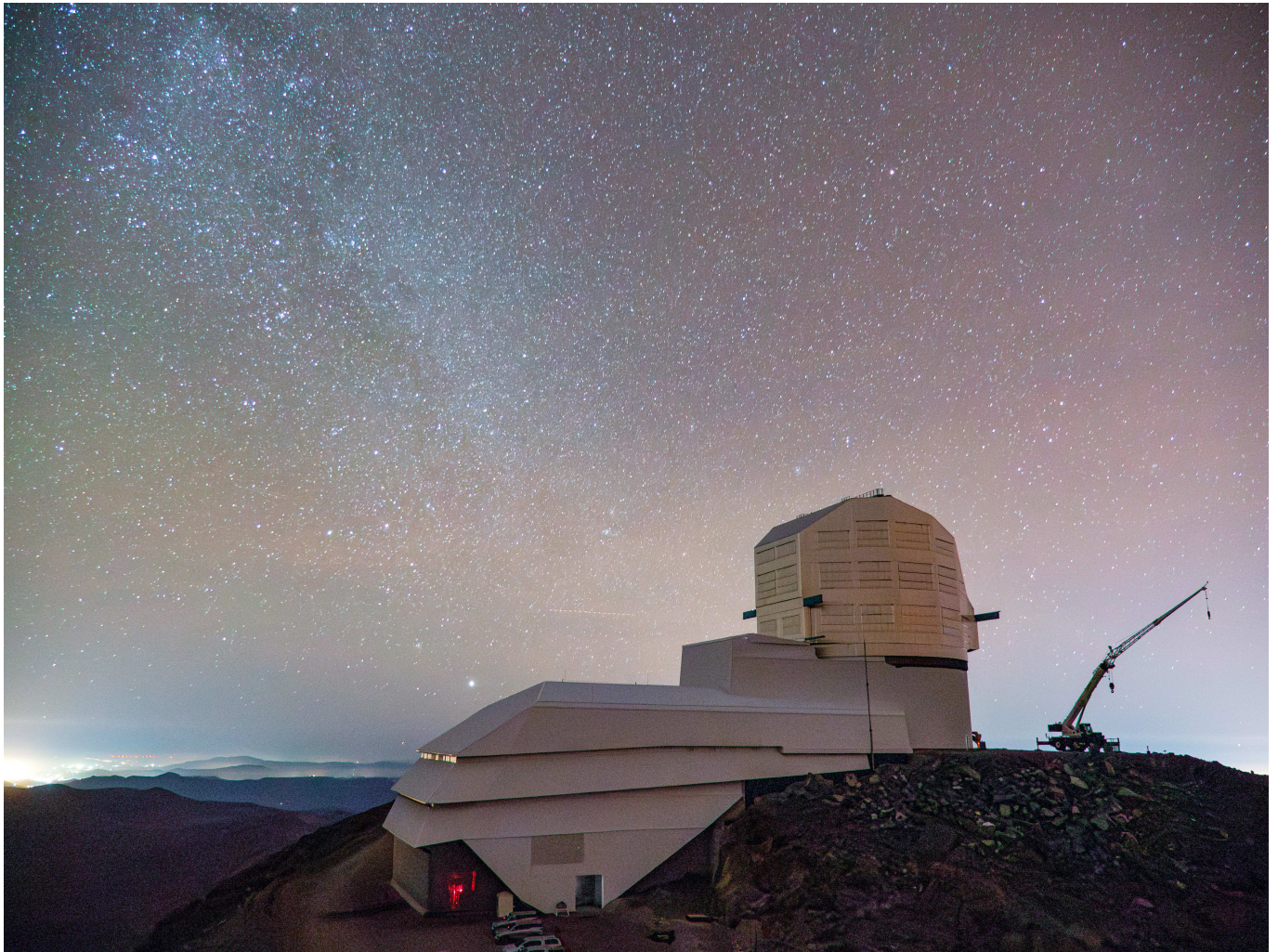
Figur 1. Vera C. Rubinobservatoriet på toppen af bjerget Cerro Pachón, Chile.

Samlet set vil LSST undersøge et himmelområde på cirka 25.000 ud af 41.253 kvadratgrader og dermed mere end halvdelen af hele himlen. Den forventede 5\sigma -punktkildedybde af et enkelt besøg ( 2 \times 15 -sekunders eksponering) i r -båndet er cirka 24,5 mag, og når det kombineres over 10 år, vil det resultere i en 5\sigma -dybde på r \sim 27 mag [3,4]. LSST vil være unik i forhold til at registrere astrofysiske objekter og transiente fænomener, der er svage eller ændrer sig enten i lysstyrke eller position inden for korte tider fra minutter til dage. Dette inkluderer galakser, eksploderende stjerner som supernovaer i fjerne galakser eller asteroider, der kunne udgøre en fare for Jorden.