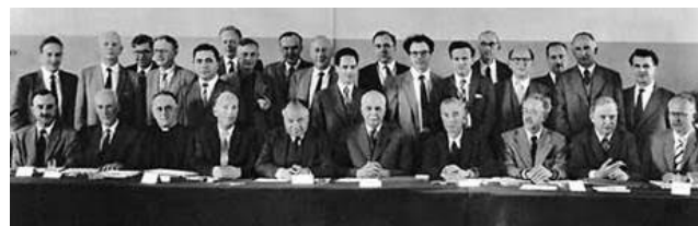
Figur 4. Deltagere i Solvaymødet fra 1958. På første række ses bl.a. G. Lemaître, W. Pauli, R. Oppenheimer og C. Møller, og på anden række O. Klein, F. Hoyle, W. Baade, J. Wheeler, H. Bondi og L. Rosenfeld.

tilsvarende selskab med omkring 200 medlemmer. Af særlig betydning var det prestigefyldte Solvaymøde (se figur 4), der for 11. gang blev afholdt i Bruxelles i 1958. For første gang i Solvayinstitutionens historie var et møde dedikeret til astrofysik, gravitation og kosmologi. Mødet var forberedt af bl.a. Lemaître, Pauli, Oppenheimer og Christian Møller, der alle var overbeviste om, at Einsteins gravitationsteori stod over for en gylden fremtid. Selv om den generelle relativitetsteori stod højt på dagsordenen i Bruxelles, var der også plads til steady-state teorien, der på mødet blev forsvaret af Gold, Bondi og Fred Hoyle.