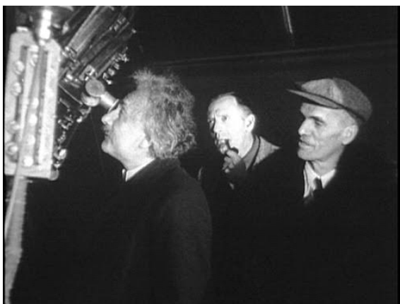
Figur 1. Einstein ved Mount Wilson-observatoriets 100" kikkert i 1931. I midten er Hubble og til højre Adams (California Institute of Technology).

Her er c lysets hastighed. Einstein opfattede en test af formelen som et "crucialt eksperiment" i den forstand, at hvis målinger klart stred imod forudsigelsen, måtte relativitetsteorien opgives. I slutningen af 1919 skrev han til Arthur Eddington: "Jeg er overbevist om, at spektrallinjernes rødforskydning er en aldeles uundgåelig konsekvens af relativitetsteorien. Hvis det skulle vise sig, at denne effekt ikke findes i naturen, må hele teorien skrottes."