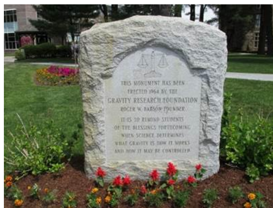
Figur 3. Mindsten for Babson og GRF ved Gordon College, Massachusetts. Stenen minder de studerende om "de velsignelser der vil komme, når videnskaben finder ud af, hvad tyngdekraften er, hvordan den virker og hvordan den kan kontrolleres." (Wikimedia Commons).

Goudsmit ville bitterligt have fortrudt, hvis hans planlagte forbud mod generel relativitetsteori i Physical Review var blevet iværksat, for i løbet af 1960'erne skete en dramatisk ændring i teoriens status og fysikernes interesse for den. Den genoplivede interesse for gravitationsfysik havde mange rødder, hvoraf en er mindre kendt og mere bizar end andre [4].