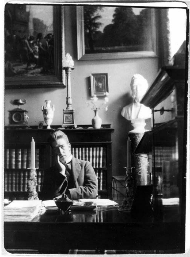
Figur 8. Christian og Niels Bohr ved Christians skrivebord. Billederne er formentlig taget på samme tid i 1911.

(Og naar man endelig taler om Præster, saa kan det være bekvemt at huske, at det plejer kun at være de mere svagt begavede, der mener at de kan forklare nogetsomhelst ved de fromme Misforstaaelser de kalder Religion, men de mere skarpe plejer, som Du vist ved, at fremhæve som det væsentligste ved Religionen at der er mere i Verden til, end hvad Mennesker kan forstaa, men de plejer blot at glemme at sige, at Mennesker kan forstaa, at det maatte være saadan).