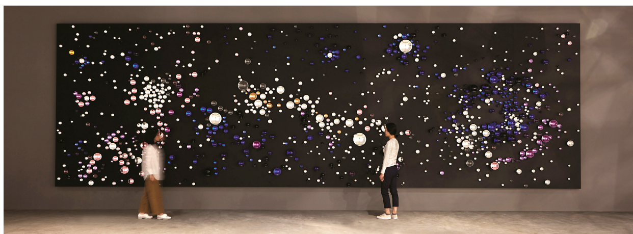
Figur 1. Olafur Eliassons kunstværk “Your unpredictable path” (2016) er opbygget af mere end tusind farvede glaskugler, hvoraf nogle af dem er belagt med sølv, så de spejler beskueren. Glaskuglerne er placeret på en sortmalet baggrund i en formation, der minder om stjernetåger. Dimensioner: 3,30 × 11 × 0,30 m. Leeum Samsung Museum of Art.