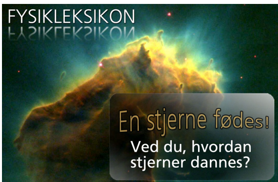
Figur 1. Et af billederne fra Fysikleksikons forsider. Baggrundsbilledet er fra NASA.

Teksterne om hvert enkelt emne er opdelt i en grundbeskrivelse, der giver en kort og letforståelig introduktion til emnet, samt en mere detaljeret og uddybende beskrivelse. Hvert emne er illustreret med et passende udvalg af billeder, tegninger og animationer. I mange tilfælde er illustrationsmaterialet fremstillet specielt til leksikonet. Et par eksempler kan ses her på siden. Mange emner ledsages af relevante film og/eller foredrag med instituttets forskere. I undervisningssammenhænge er det tanken, at grundbeskrivelsen umiddelbart skal kunne forstås af en folkeskoleelev, mens den uddybende beskrivelse skal nå dybere og give udbytte for en gymnasieelev.