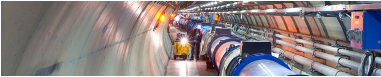
Figur 3. Verdens længste vakuumkammer (med et tryk på under 10^{-12} mbar) har en omkreds på 27 km. Røret i midten indeholder et indre rør for protonstrømmen på 7 TeV, der holdes på plads af superledende magneter med en temperatur på 1,9 K [3].

Alle egenskaber, som er bestemt af elektronstrukturen, dvs. de kemiske og optiske egenskaber, er praktisk talt ens for alle brintmolekyler, men alt hvad der har med massen at gøre, afhænger stærkt af den specielle isotop kombination. I øvrigt blev deuterium først entydigt påvist af den amerikanske kemiker Harold Urey, som for dette arbejde fik Nobelprisen i kemi 1934. Urey kaldte så den nye isotop for deuterium, inspireret af de græske og latinske ord for "to", svarende til et brintatom med massetallet 2 [2]. Vi har så at gøre med det faste stof med de største forskelle fra den ene til den anden isotopkombination. De molekylære faste stoffer H_2 , D_2 og HD har for eksempel så vidt forskellige krystalstruktur, smeltepunkter og kondenseringstemperatur i vakuum (tabel 2), og består alle af molekyler, der er ordnet i et gitter.