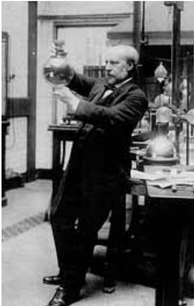
Figur 1. James Dewar (1842-1923) var skotsk kemiker og fysiker.

Stoffet er fast brint, der først gang blev bragt i fast form i 1899 af James Dewar, der også er kendt for den beholder til opbevaring af kolde væsker, som han lagde navn til, en Dewar-beholder [1]. Ironisk nok blev fast brint kondenseret ud fra afkøling af brint i hans egen kølemaskine uden brug af flydende helium, da det på dette tidspunkt var vanskeligt at skaffe tilstrækkelige mængder af heliumgas.