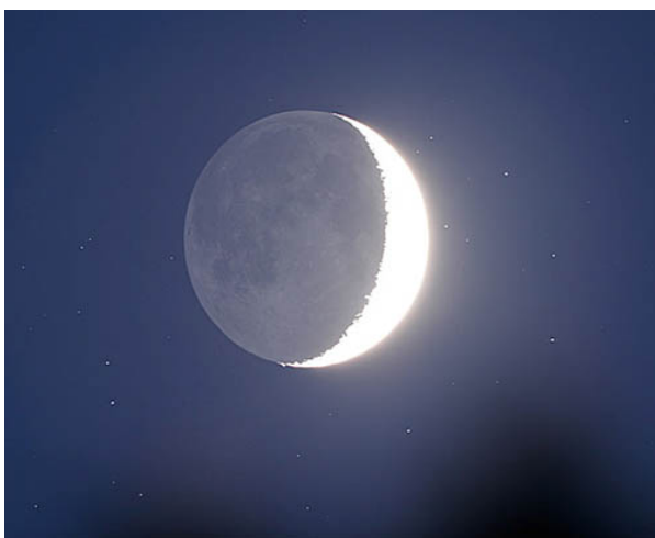
Figur 1. Månen med dens Askelys. Den del af Månen der belyses af Solen direkte er her helt overeksponeret og fremtræder helt hvid og udefineret, medens den normalt mørke del, der her ses belyst af Jordens reflekterede sollys viser detaljer. Måling af Askelysets intensitet fortæller om Jordens reflektivitet. Prikkerne på himmelen er stjerner; Askelyset er dermed på niveau med stjernernes lys, intensitetsmæssigt. Bemærk antydningerne af spredt lys på himmelen rund om Månen.

Ser man på Månen ved nymåne bemærker man at den mørke del faktisk kan ses – den er belyst af Jorden, altså af det lys der reflekteres fra Jorden (figur 1). Dette lys kaldes på dansk 'Askelyset' eller jordskinnet og har en intensitet der er proportionalt med Jordens reflektivitet.